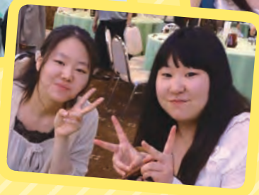
6月14日 新人歓迎ポーリング大会開催