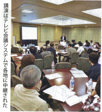
講演はテレビ会議システムで各地に中継された

福祉・介護・医療経営戦略コンサルタントを講師に行われたセミナーでは、介護報酬改定の裏を読み解き、「医療と介護の融合」をメインにする」とされる「2018年診療報酬・介護報酬ダブル改定」までに、どのような経営戦略を策定し、実行すべきかを検討した。「地域包括ケアはいわゆる百貨店づくり。百貨店になるかテナントの1店になるかは、経営者次第。制度・政策・報酬の「先取り」を」との説明に、真剣に耳を傾ける姿があった。その後、参加者らは情報交換など交流を深めていた。