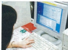
初心者にもわかりやすい