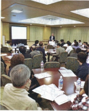
講演はテレビ会議システムで各地に中継された

今年度の介護報酬改定で小規模デイサービス(月平均延べ利用者数が300人以下)の介護報酬が1割近くカットされた。そのような背景から、デイサービス事業から撤退する事業者が増えている。3年後に行われる「診療報酬・介護報酬改定」は、市内の社会福祉法人や医療法人の経営者、介護事業者やその関係者ら約70人が参加した。福祉・介護・医療経営戦略コンサルタントを講師に行われたセミナーでは、介護報酬改定の裏を読み解き、「医療と介護の融合」をメインにするとされる「2018年診療報酬・介護報酬改定」まで、どのような経営戦略を策定し、実行すべきかを検討した。「地域包括ケアはいわゆる百貨店づくり。百貨店になるかテナントの1店になるかは、経営者次第。制度・政策・報酬の「先取り」を」との説明に、真剣に耳を傾ける姿があった。その後、参加者らは情報交換など交流を深めていた。