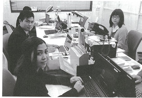
高度外国人材の3人

きた。開設当初から「地元・地域のために貢献すること」を基本理念の一つに活動している。